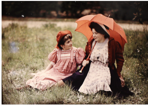
Autochrome - Musée des Frères Lumière - Lyon