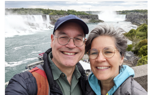
Mai - Chutes Niagara