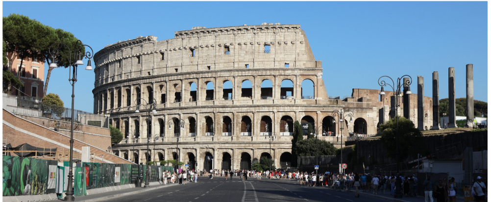
Rome - Le Colisé, un incontournable