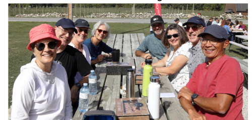
Sept. - aux pommes - Franklin QC