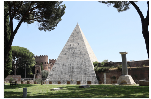
La pyramide de Caius Cestius Un de mes trucs favoris à Rome