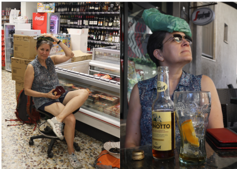
Fa troppo caldo !!! Porto Ercole - notre randonnée à vélo prend fin la tête dans le congélateur à pizza, un sac de pois congelé sur le coco et du sorbet au citron. On se refroidit au pub du coin pendant quelques heures.