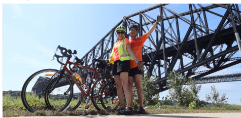
Août - Weekend à Québec