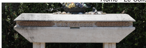
Porto Ercole - Pèlerinage Caravaggio