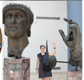
Fa "encore" troppo caldo !!! Rome - Température torride. On va au "Musei Capitolini". Civilisation romaine.. et air climatisée.