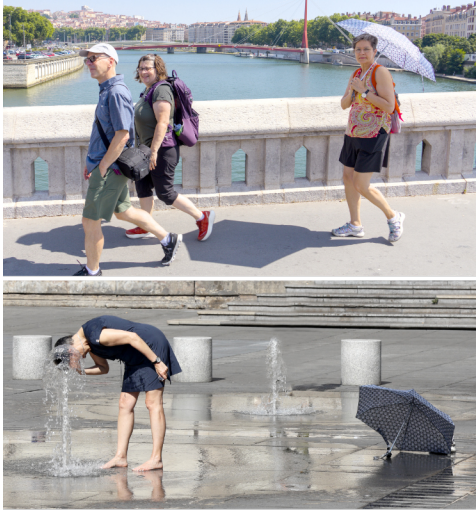
Il fait trop chaud !!! - Lyon