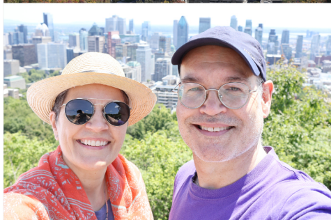
Février et Juin - Marche au Mont-Royal