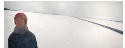
Mai - Visite du McMichael Canadian Art Collection