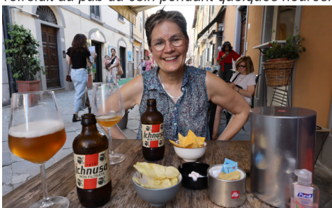
Orbetello - Une bonne bière froide bien méritée